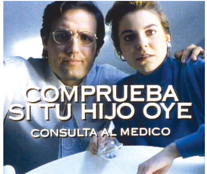
Secuencias del spot publicitario en televisión.

El spot se iniciaba con una imagen en silencio que situaba al espectador en el punto de vista de un bebé con sordera que observa a sus padres inclinados sobre su cuna agitando un sonajero. Esta imagen, en un principio habitual en muchos hogares, generaba una actitud de alerta en el espectador ante el desconcierto de los padres porque su hijo no respondía al sonajero, al tiempo que se oía la emisión en off del lema de la Campaña "Comprueba si tu hijo oye". Con esta imagen se intentó, además, subrayar el protagonismo que, en especial, tienen los padres a la hora de paliar las consecuencias de una deficiencia auditiva, gracias a un diagnóstico temprano y a los subsiguientes procesos de ayuda y rehabilitación.